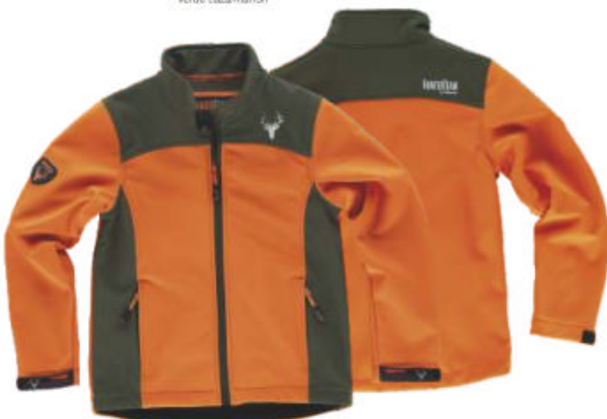
naranja a.v.verde caza

Tejido: 96% Poliéster 4% Elastano (300 g/m 2 )