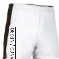
BLANCO / NEGRO