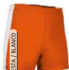
N. FIESTA / BLANCO