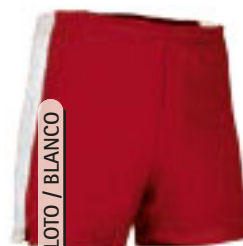
ROJO LOTO / BLANCO