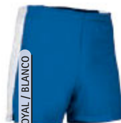
AZUL ROYAL / BLANCO