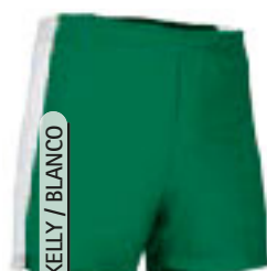
VERDE KELLY / BLANCO