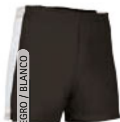
NEGRO / BLANCO