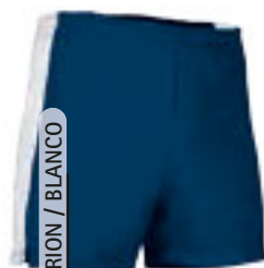
A. M. ORION / BLANCO